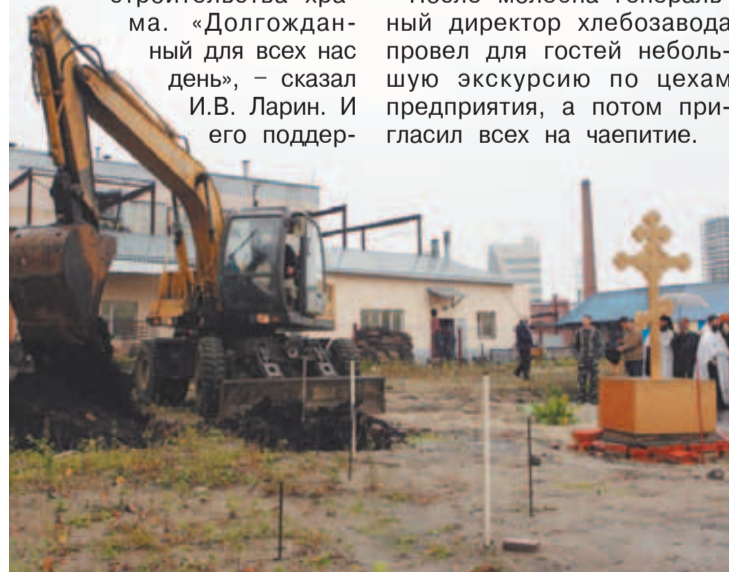
Страница подготовлена Щелковским благочинием

После молебна генеральный директор хлебозавода провел для гостей небольшую экскурсию по цехам предприятия, а потом пригласил всех на чаепитие.